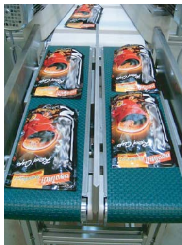
Trasportatori con tappeto ad alto attrito per l'unificazione 2 in 1 di confezioni tipo doypack