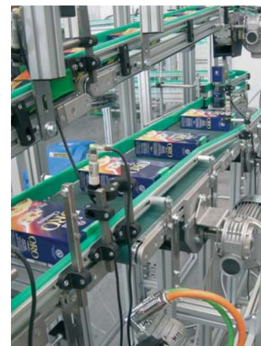
Sistema di tappeti F6 per fasatura e incollaggio di due scatole di cartone