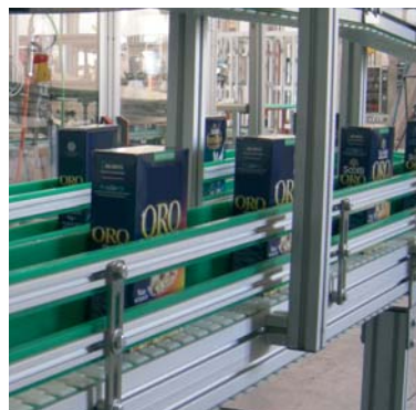
Linea completa su diversi livelli per il confezionamento del riso