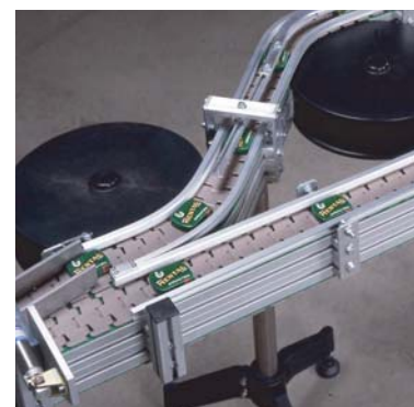
Linea di trasportatori per scatole di caramelle